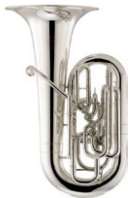
PETRUSCHKA 5 PISTONES