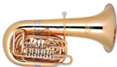
88 5 CILINDROS