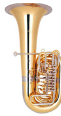
81C 6 CILINDROS