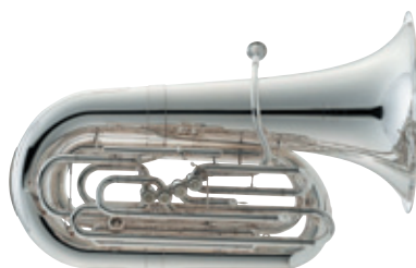
NEW YORKER 5 PISTONES