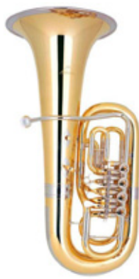
81A 4 CILINDROS